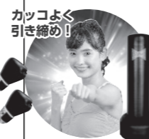
カッコよく引き締め！